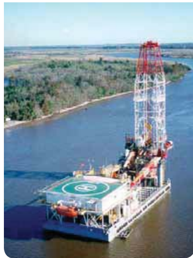
شکل ۲: بارج