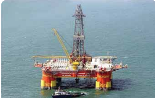
شکل ۵: نمونه‌ای از دستگاه حفاری نیمه شناور

موقعیت یا خود جلویی است. تعدادی از دستگاه‌های نیمه‌شناور، در قسمت پایین؛ یک جفت از ستون‌های پایدار کننده، پانتون یا صندوق‌های مخصوص دارند. آرایش عمومی آنها شامل ۸ ستون (۴ عدد ستون‌های پایدار کننده و ۴ عدد ستون‌های میانه) و دو بدنه یا ستون که برای بالاست کردن و همچنین منبع تغذیه استفاده می‌شود. دستگاه حفاری امیر کبیر (ایران البرز سابق) متعلق به شرکت نفت خزر تنها دستگاه نیمه‌شناور کشور است (شکل ۵). این دستگاه توسط شرکت صدرا ساخته شده است.