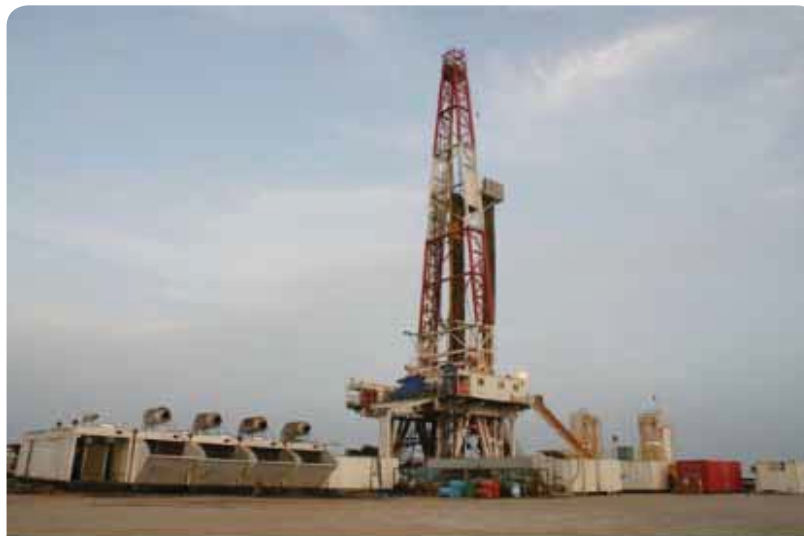
شکل ۱: دستگاه حفاری خشکی متعلق به شرکت حفاری شمال

کشتی، سه‌گوش، چهارگوش یا به شکل نامنظم باشند، که با تعدادی تیر مشبک یا پایه لوله‌ای شکل (Leg) به کف دریا متصل می‌شوند. زمانی که دستگاه حفاری در حال یدک‌کشی به محل حفاری است، پایه‌ها بالا بوده و فقط کمی زیر عرشه هستند و دستگاه حفاری شبیه به یک جعبه در حال کشش است، لذا فقط در دریاها با عمق مناسب و آرام و با سرعت پایین قابل کشیده شدن هستند. به محض رسیدن به محل حفاری، پایه‌ها بوسیله جک‌های برقی یا هیدرولیکی پایین آورده می‌شوند تا به کف دریا رسیده و عرشه حدود ۶۰ فوت یا بیشتر بالای امواج تراز شود. بیشتر دستگاه‌های حفاری جک دو، سه، چهار یا پنج پایه دارند، اما