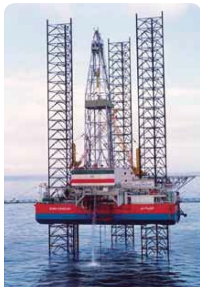
شکل ۳: دستگاه حفاری جک آپ، ایران خزر

(Substructure) در محل مناسب قرار گرفته و به وسیله خدمه دکل به همدیگر پین می‌شوند، سپس گردونه حفاری در محل خود قرار گرفته و قطعات دکل به صورت افقی خوابانده و به همدیگر متصل می‌شوند. در نهایت دکل بوسیله گردونه حفاری و کابل بالا بر افراشته می‌شود. یک دستگاه حفاری در حال کار در شکل ۱، نشان داده شده است. قدرت این دستگاه ۲۰۰۰ اسب بخار، توان تحمل دکل یک میلیون پوند بوده و جهت حفاری تا عمق ۷۰۰۰ متر طراحی شده است.