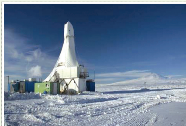
شکل ۹ | حفاظت در برابر سرما در دستگاه حفاری (از این شیوه می‌توان برای دفاع غیرعامل دستگاه به سبب هم‌رنگ شدن با منطقه استفاده نمود)

۱۸. اطلاع‌رسانی حقیقی و کامل به کارکنان و تقویت اخلاق و روحیه آنان.