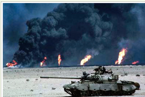
شکل ۸ | انفجار چاه‌های نفت کویت توسط عراق به‌منظور ایجاد پرده دود در برابر دید دشمن (جنگ اول خلیج فارس)

ماهوره‌های هدایت کننده برای انحراف بمب [۱۷].