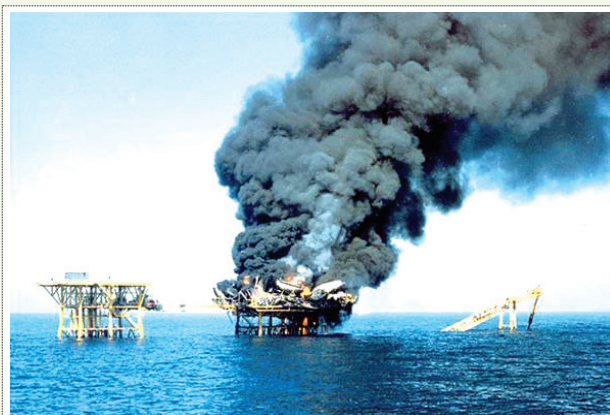
۴ | آتش سوزی چاه نفت نوروز در جنگ تحمیلی

گاز یک امتیاز در پدافند غیر عامل آن‌ها محسوب می شود و باید حداکثر بهره برداری را از آن انجام داد [۶].