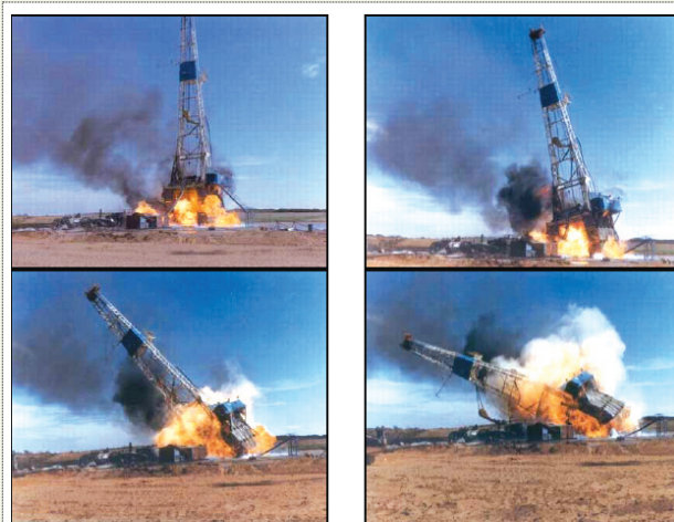
۳ | نمونه ای از انفجار در صنعت نفت (دستگاه حفاری خشکی)

مکان یابی عبارت است از انتخاب بهترین و مطلوب ترین نقطه و محل استقرار، به طوری که پنهان و مخفی نمودن نیروی انسانی، تجهیزات