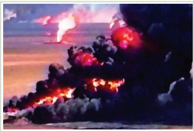
۵ | انفجار و آتش سوزی مخزن سوختی

حفاظت مخازن مواد سوختی نیاز به توجه خاصی دارد. مخازن، نور را از سقف و بدنه مدورشان منعکس ساخته و دارای سایه هستند. بنابراین همواره توجه دشمن را به خود معطوف می سازند. تجربه حمله عراق به خارک و پالایشگاه آبادان به خوبی بیان گر این مسئله است. استتار مخازن توسط تور مشکل بوده و همچنین ممکن است آتش سوزی ایجاد کند. تجربیات نشان داده که تنها راه اختفای موثر آن‌ها، دفن تمام یا قسمتی از مخازن در سطح پایین تر از زمین است. البته این عمل نیز تنها برای مخازن جدید میسر است و برای مخازن قدیمی باید راه حل مناسبی یافت [۶].