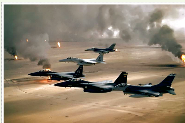
شکل ۷ | انفجار چاه‌های نفت کویت توسط عراق به‌منظور ایجاد پرده دود در برابر دید دشمن (جنگ اول خلیج فارس)

حفاظت از خطر اصابت بمب‌های لیزری در اطراف این اماکن. (البته در این باره باید ملاحظات زیست محیطی در نظر گرفته شود). ۱۴. ایجاد اختلال در ارتباط بین بمب‌های هدایت شونده توسط GPS و