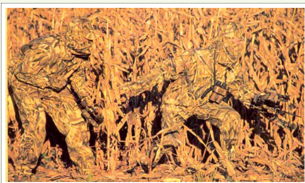
۲ | استتار (یکی از شیوه‌های پدافند غیر عامل)