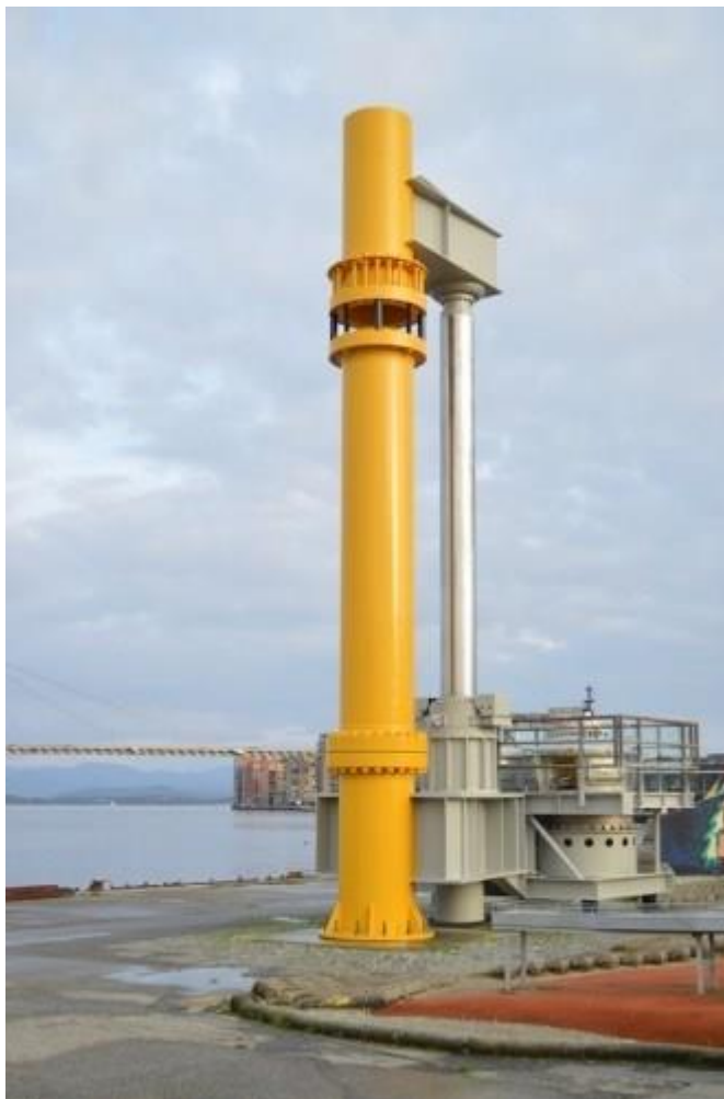
کتاب موزه نفت نروژ

کتاب موزه نفت نروژ (Petrorama) در سال ۲۰۰۰ منتشر شده است. مطالب ارائه شده در این کتاب شامل گزارشی از کلیه نمایشگاه های برگزار شده در موزه نفت، تاریخچه صنعت نفت نروژ و تصاویری از معماری داخلی و نمای ساختمان موزه توسط معماران آن است.