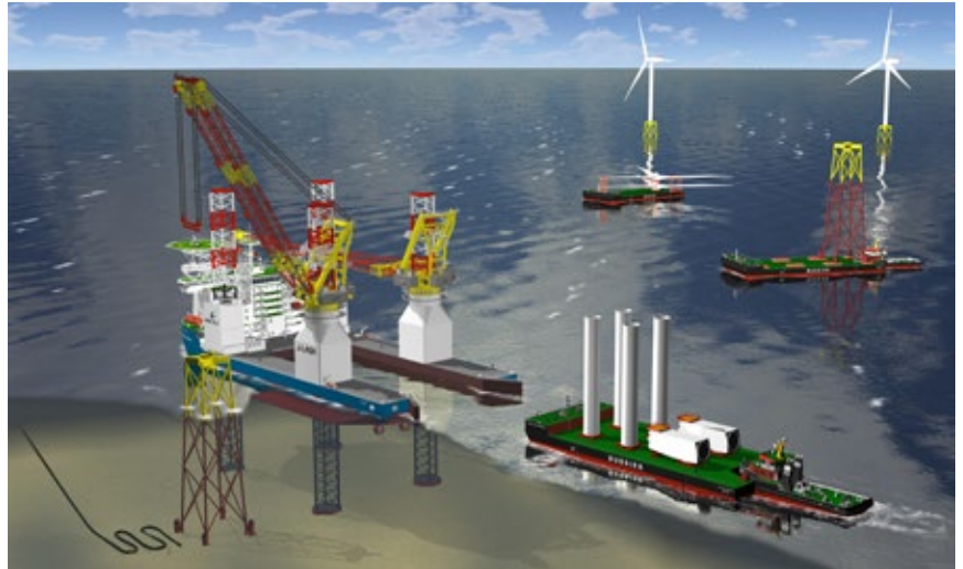
شکل ۶: جک‌آپ نصب توربین‌های بادی فراساحل

«مخازن نگهداری مواد اولیه، برای ذخیره سازی مواد افزودنی به گل حفاری نظیر باریت، بنتونیت و همچنین سیمان، مخازنی در واحد حفاری تعبیه می‌گردد.