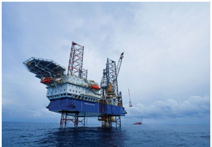
شکل ۷: یک جک‌آپ در حال عملیات حفاری

به علت شرایط عملیاتی دکل‌های حفاری دریایی و دوری آنها از مراکز تأمین مواد مورد نیاز، به منظور ذخیره‌سازی و نگهداری آب و مواد مایع دیگر، مخازن مختلفی پیش‌بینی می‌شود. نوع، تعداد و حجم این مخازن