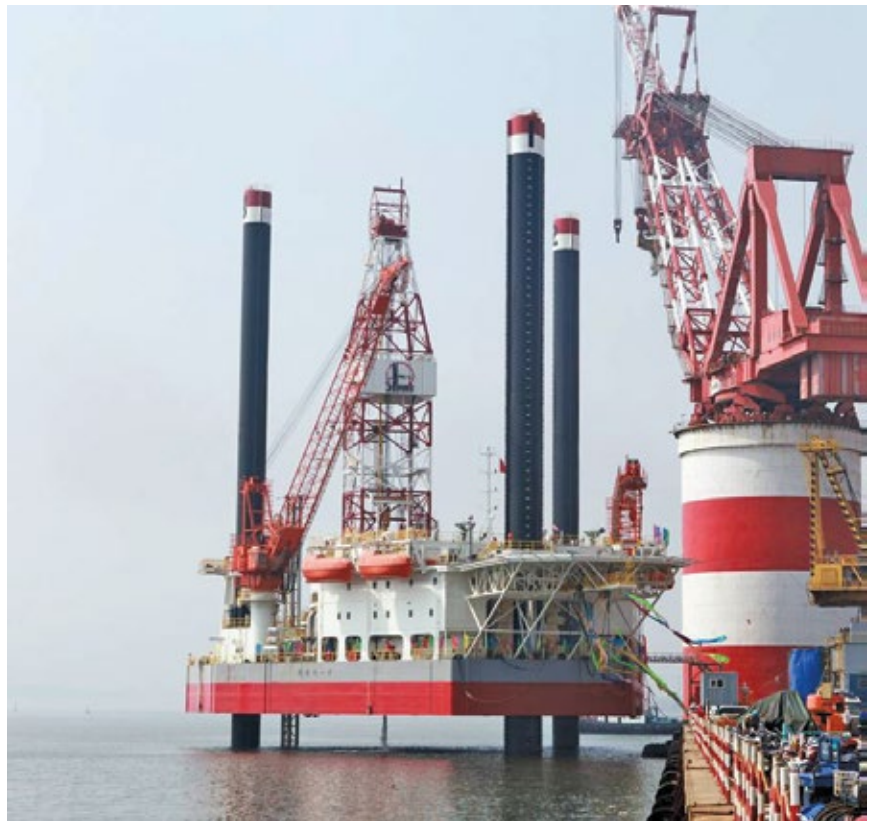
شکل ۲: یک نما از جک آب با پایه های استوانه ای

موتورهای دریایی بدلیل حساسیت های کاری و محیطی پیشرفته تر از موتورهای خشکی می باشد. تعداد موتورها نیز در دستگاه حفاری دریایی بدلیل مصرف کننده های بیشتر ۵ دستگاه بوده که یکی بیشتر از دستگاه های خشکی می باشد دستگاه دریایی حتماً باید مجهز به موتور اضطراری باشد که در مواقع لزوم بتواند برق روشنایی دستگاه را تأمین نماید. این موتور دارای توان کمتری نسبت به موتورهای اصلی است و محل نصب آن در قسمت فوقانی استراحت گاه پرسنل می باشد و مجهز به سیستم اتوماتیک راه انداز می باشد که در صورت قطع برق به صورت خود کار روشن می شود. سیستم هوای فشرده در دستگاه حفاری دریایی بدلیل شرایط خاص آب و هوایی و وجود رطوبت فراوان الزاماً بایستی مجهز به سیستم رطوبت گیر و خشک کن باشد، چرا که ورود رطوبت به درون هوا علاوه بر افزایش خوردگی مسیر و لوله ها باعث مسدود شدن مجاری کلیدها و سویچ های هوایی شده و موجب از کار افتادن تجهیزات نیوماتیکی می گردد. لذا علاوه بر وجود فیلترهای رطوبت گیر در مسیر معمولاً از خشک کن های تبریدی یا جذبی جهت خشک کردن هوا استفاده می شود.