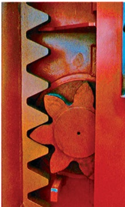
شکل ۳: یک نما از دنده

بالا و پایین بردن پایه ها توسط مکانیزمی به نام Jacking system انجام می شود. این سیستم پایه ها را در مجرا تعبیه شده به بالا و پایین حرکت می دهد. در هنگامی که پایه ها بر روی بستر دریا قرار دارند این سیستم بدنه را بالا می برد و هنگامی که بدنه بر روی سطح آب شناور است این سیستم پایه ها را بالا می آورد. در مجموع از دو روش هیدرولیکی (Ram & Pin) و الکتریکی دنده و شانه (Rack & Pin) برای بالا و پایین بردن پایه ها استفاده می شود. روش هیدرولیکی که از جک های هیدرولیکی در آن استفاده می شود روش قدیمی تری می باشد که امروزه به دلیل مشکلات ناشی از نشت روغن و سختی کار کاربرد کمتری دارد. در روش الکتریکی چرخ دنده های بزرگی که نیروی خود را از گیربکس متصل به الکتروموتور دریافت می کنند باعث حرکت شانه (Rack) هایی که بر روی ستون های (Chord) پایه ها نصب شده و در نتیجه پایه های متصل به شانه ها با حرکت چرخ دنده ها بالا و پایین می روند. پس از آنکه پایه ها در جای خود قرار گرفتند لازم است پایه ها نسبت به بدنه ثابت گردند. در پایه های از نوع خرپا از Rack chock یا Leg guide chock و در پایه های استوانه ای از Shim که قطعات فلزی نیم دایره ای شکل فلزی می باشند استفاده می شود.