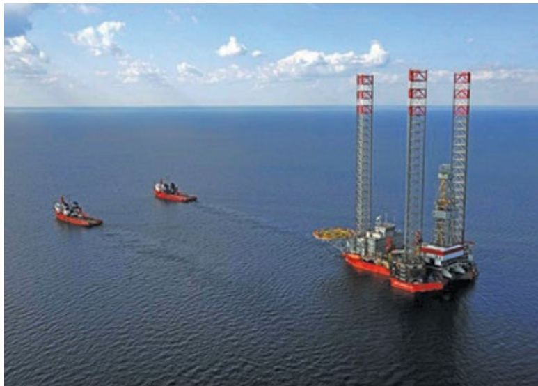
شکل ۸: انتقال جک آپ به وسیله یدک کش

« Navtex، تمام اطلاعات مربوط به امور دریایی، اتفاقات، پیش بینی آب و هوا و مسائلی از این دست به صورت نوشتاری توسط این دستگاه دریافت می‌گردد.