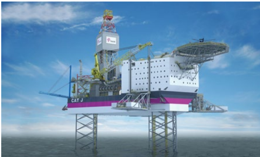
شکل ۴: یک مدل کامپیوتری از جک آپ

از آنجا که واحدهای حفاری دریایی عمدتاً در مناطق دور از ساحل حفاری می کنند و کارکنان دکل حداقل به مدت دو هفته کامل در آن به سر می برند، کلیه تمهیدات لازم برای سکونت و آسایش آنان در دکل پیش بینی می گردد. به این قسمت Accommodation گفته می شود. تأمین رفاه و آسایش کارکنان در هنگام سکونت در واحد دریایی و ایجاد فضای مناسب برای استراحت آنان، در برطرف کردن و یا کاهش خستگی جسمی و روحی ناشی از کار و دوری از خانه و در نتیجه کاهش خستگی جسمی و روحی ناشی از کار و دوری از خانه و در نتیجه کاهش ضریب اشتباه (که گاه ممکن است باعث ایجاد خسارات جبران ناپذیر گردد) نقش به سزایی دارد. به عنوان مثال سیستم های تهویه و میزان عایق بودن دیوارها به گونه ای است که بتواند شرایط آب و هوایی مطلوب را در اتاق فراهم نماید. وسایل موجود در اتاق از لحاظ نوع، شکل طراحی، چیدمان و نحوه نصب نیز قوانین و مقررات مخصوص به خود را دارند که در استانداردها و کتب راهنما به تفصیل بیان گردیده اند. معمولاً افراد ساکن در یک اتاق دو نفره در دو شیفت متفاوت کار می کنند که این امر باعث می شود هر فرد در شیفت استراحت خود در اتاق تنها باشد. همچنین جک آپ به واحدهای غذاخوری (Mess Room)، آشپزخانه (Galleys)، انبار و سردخانه برای نگهداری مواد غذایی، واحد لباسشویی (Laundry Room)، مکان هایی برای استراحت و تفریح نظیر سالن بدن سازی و اتاق تلویزیون (TV Room) و... مجهز می گردد. سالن غذاخوری یک دکل را نشان می دهد. همچنین دفاتر اداری، آرشیو اسناد فنی، بخش مخابرات و ناوبری نیز در Accommodation جای داده می شوند. کلیه قسمت های گفته شده در طبقات مختلف Accommodation که معمولاً چهار یا پنج طبقه است، قرار دارند. تناسب فضای اختصاص داده شده به هر