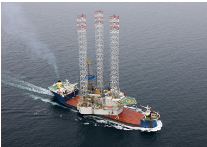
شکل ۵: حمل جک آپ به وسیله کشتی

منظور از بدنه (Hull)، قسمت Barge شکل دکل حفاری می باشد. کلیه تجهیزات مورد نیاز دکل، اعم از تجهیزات حفاری (Drilling Equipments)، محل های زندگی کارکنان و دفاتر اداری (Accommodation)، مخازن (Tanks)، انبارها، و... در داخل بدنه و یا روی عرشه (Deck) آن قرار گرفته اند. بدنه دکل باید به گونه ای طراحی و ساخته شود که ضمن داشتن فضای مناسب و استفاده بهینه از آن برای نصب تجهیزات، از استحکام کافی برای تحمل بارهای وارده در حین عملیات برخوردار باشد. علاوه بر این از آنجا که جک آپ ها به هنگام حمل و نقل در دریا، در معرض امواج دریا قرار دارند، سازه آنها باید توان تحمل بارهای ناشی از امواج آب و کلاً کار در محیط دریا را داشته باشد. طراحی بدنه (Hull) و قسمت های مختلف دکل باید به گونه ای باشد که کلیه آب های سطحی به این مخازن منتقل گردد، به عبارت دیگر آب در هیچ یک از قسمت ها جمع نشود. بدنه بیشتر به صورت سه گوش یا چهار گوش ساخته می شود. ضخامت یا در واقع ارتفاع بدنه بین ۶ تا ۹ متر می باشد. پهنا و طول بدنه بستگی به نوع طراحی و نیاز می تواند بین ۶۰ تا ۱۰۰ متر می باشد. البته بدنه با طول یا پهنای بیشتر به ویژه در مورد جک های نصب توربین های بادی (Construction Jackup) ها وجود دارد، در مورد این نوع جک آپ پهنا تا ۱۵۰ متر نیز می رسد زیرا از سطح جک آپ برای حمل پایه های توربین های بادی نیز استفاده می شود. که طول و پهنای بدنه که تعیین کننده فاصله میان پایه ها می باشد به ارتفاع پایه ها بستگی دارد. هر چه ارتفاع جک آپ بیشتر باشد برای حفظ تعادل آن باید فاصله پایه ها زیادتر شود.