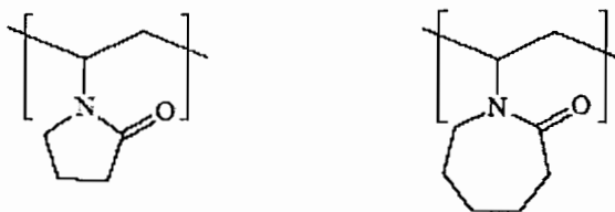
شکل ۱- مونومرهای پلی وینیل پیرولیدن و پلی وینیل کپرولاکتام [۵]

این نوع از بازدارنده ها که در دهه اخیر مورد توجه قرار گرفته اند به جای تغییر در شرایط ترمودینامیکی تشکیل هیدرات، سینتیک تشکیل را تغییر می دهند. این ترکیبات هم هسته سازی و هم رشد کریستالی را کند می کنند [۵]. مکانیزم ملکولی این مواد و اثرات متقابل آنها هنوز کاملاً اثبات نشده است اما دو تئوری بیشتر مورد توجه است که هر دو با استفاده از شبیه سازی دینامیک ملکولی ارائه شده اند. اولین تئوری بیان می کند که جذب سطحی این ترکیبات بر روی کریستالها باعث از بین رفتن و یا کاهش شدید نقاط فعال آنها شده و لذا رشد آنها را متوقف می کند. مکانیزم دوم بیانگر این است که ملکولهای پلیمری بازدارنده های سینتیکی به صورت مانعی در راه نفوذ ملکولهای مهمان عمل کرده و از تکامل کریستال جلوگیری می کنند [۸]. عدم وجود مکانیزم مشخص، پیش بینی عملکرد این بازدارنده ها را دشوار می کند و این یکی از معایب کنونی این مواد است. مثلاً بعضی از بازدارنده های سینتیکی در غلظت زیاد میتوانند تشکیل هیدراتهای گازی را تسریع کنند [۸]. از جمله می توان به پلی وینیل پیرولیدن، پلی وینیل متیل استامید و وینیل کپرولاکتام اشاره کرد (شکل ۱). این مواد به صورت محلول و در غلظت های بسیار کم (اغلب کمتر از ۰.۱٪) به سیستم تزریق می گردند و بنابر این میزان مصرف آنها بسیار کمتر از بازدارنده های ترمودینامیکی است. در چند سال اخیر مواردی صنعتی از استفاده این مواد ذکر شده است.